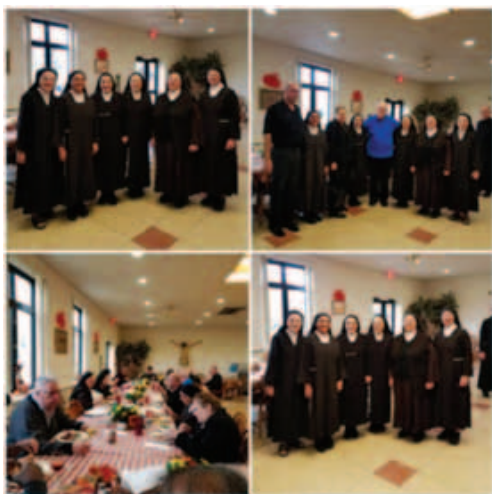
In Bordentown for Thanksgiving A Bordentown, dai Verbiti, per la festa del Thanksgiving