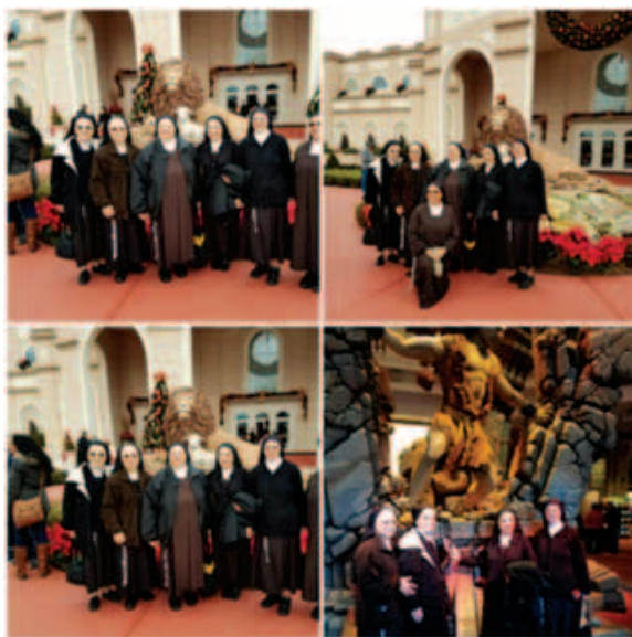
At Sights & Sounds Theater in Lancaster, PA, for the biblical production of SAMSON A Sights & Sounds Theater in Lancaster, PA, per la produzione biblica di SANSONE