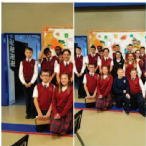
At St. Michael School, Clayton A St. Michael School, Clayton