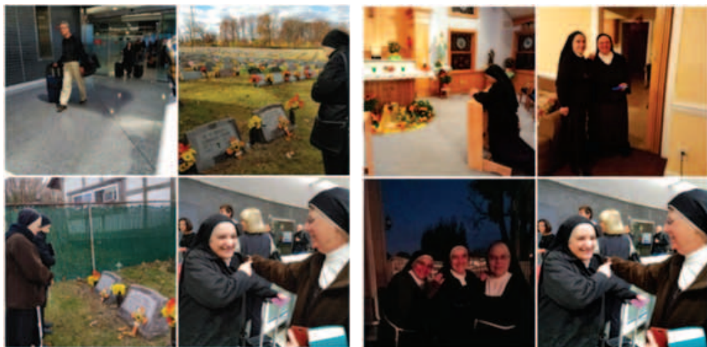
Arrival 1 and visit to the cemetery Arrivo 1 e visita al cimitero